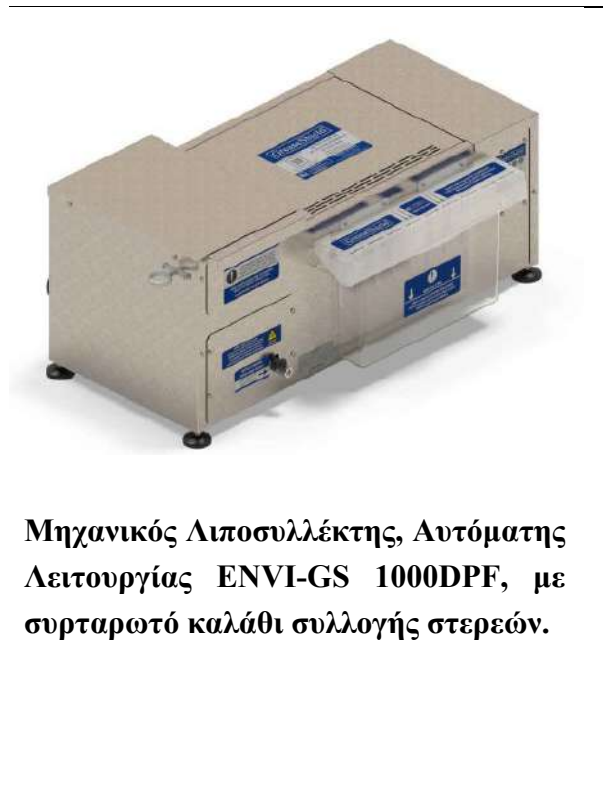
Μηχανικός Λιποσυλλέκτης, Αυτόματης Λειτουργίας ENVI-GS 1000DPF, με συρταρωτό καλάθι συλλογής στερεών.

Ο μηχανικός λιποσυλλέκτης, αυτόματης λειτουργίας, ENVI-GS 1000DPF είναι ότι πιο σύγχρονο υπάρχει, σήμερα, στον εξοπλισμό συλλογής και απομάκρυνσης ελαιωδών ουσιών (λάδια, λίπη, έλαια) από υγρά απόβλητα, που παράγονται στις λάντζες των κουζινών μαζικής εστίασης ή/και σε παρόμοιες δραστηριότητες, όπως οι φούρνοι έψησης κοτόπουλων και κρέατος. Η λειτουργία του λιποσυλλέκτη ENVI-GS 1000DPF είναι πλήρως αυτοματοποιημένη και ελέγχεται ηλεκτρονικά, χωρίς να απαιτεί την εμπλοκή προσωπικού για το διαχωρισμό των ελαιωδών ουσιών και των στερεών υπολειμμάτων τροφών, από τα απόβλητα της λάντζας, αλλά ούτε και για τον καθαρισμό του.