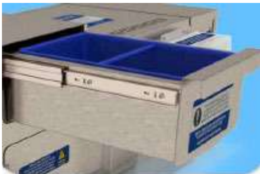
Αποσπώμενο Φίλτρο Συλλογής και Απομάκρυνσης Στερεών Σωματιδίων

Το εξωτερικό δοχείο συλλογής και προσωρινής αποθήκευσης των ελαιωδών ουσιών, αποσπάται εύκολα από το λιποσυλλέκτη για να αδειάσει από τις ελαιώδεις ουσίες, να καθαριστεί εύκολα και να επαναχρησιμοποιηθεί.