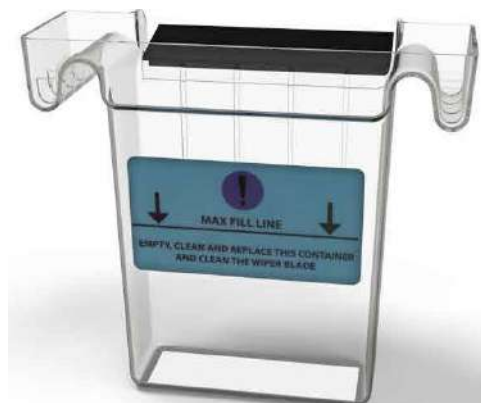
Εξωτερικό, αποσπώμενο Δοχείο Συλλογής και Απομάκρυνσης Ελαιωδών Ουσιών