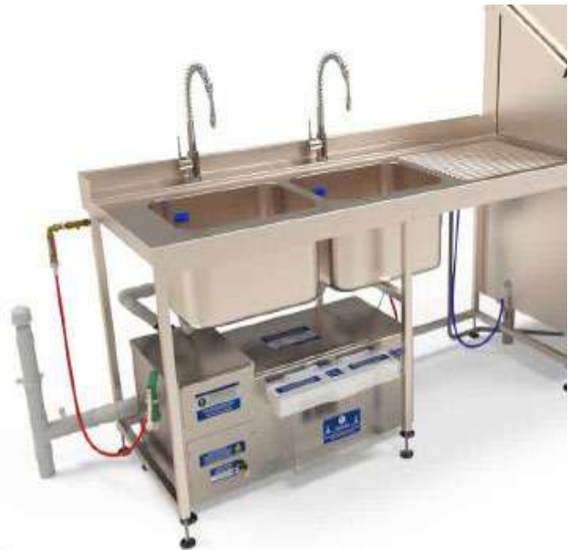
Τοποθέτηση Λιποσυλλέκτη ENVI-GS 1000DPF κάτω από Λάντζα βάθους 300mm.

Στη συνέχεια τα υγρά απόβλητα τροφοδοτούνται στο λιποσυλλέκτη, όπου η ταχύτητα ροής τους μειώνεται, με τη δημιουργία συνθηκών ηρεμίας, για να δοθεί η δυνατότητα διαχωρισμού των ελαιωδών ουσιών από την υδατική φάση του υγρού αποβλήτου. Ο συνολικός όγκος του νερού μαζί με τις ελαιώδεις ουσίες, που βρίσκονται μέσα στο λιποσυλλέκτη, έρχονται σε επαφή με έναν μεγάλο περιστροφικά κινούμενο, οριζόντιο κύλινδρο, ο οποίος έχει στην επιφάνεια του λιπόφιλη και ταυτόχρονα υδρόφοβη μεμβράνη επάνω στην οποία προσκολλώνται μόνον οι ελαιώδεις ουσίες και όχι η υδατική φάση του υγρού αποβλήτου. Καθώς ο κύλινδρος περιστρέφεται απομακρύνει τις ελαιώδεις ουσίες από την υδατική φάση και από το εσωτερικό του λιποσυλλέκτη. Οι ελαιώδεις ουσίες απομακρύνονται από την λιπόφιλη μεμβράνη από ειδικό ξέστρο καθαρισμού, με αντιστατικές ιδιότητες, οδηγώντας αυτές σε ξεχωριστό, εξωτερικό, διάφανο δοχείο απόρριψής τους, αυτόματα και συνεχόμενα, έξω από το λιποσυλλέκτη, χωρίς αυτό να χρειάζεται αυτό να γίνει από το προσωπικό της κουζίνας.